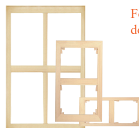
Formats européens doubles carrés