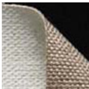
← Toile 17 Lin. Grain moyen Enduction huile