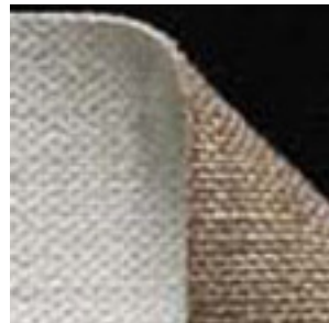
→ Toile 41 Lin. Grain fin Enduction huile