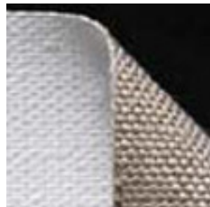
→ Toile 120 Lin. Grain moyen Enduction universelle