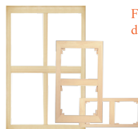
Formats européens doubles carrés