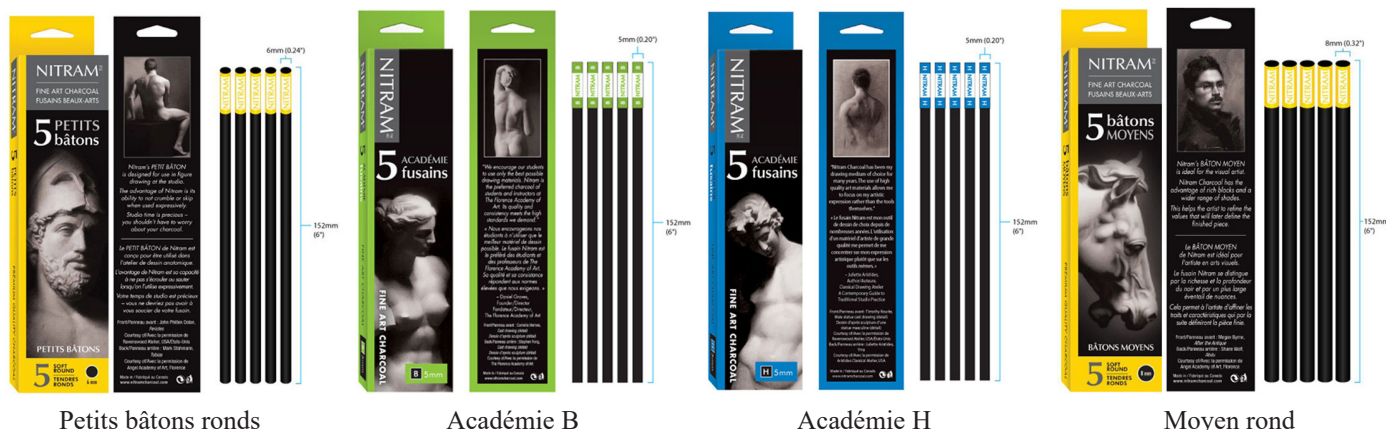
Petits bâtons ronds