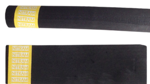
Demi bâton de saule rond

Qualité exceptionnelle. Noirs profonds et gris veloutés. Nitram est le palindrome de Martin, nom du créateur Jovinien de la marque.