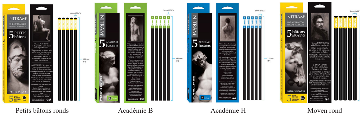
Petits bâtons ronds