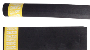
Demi bâton de saule rond