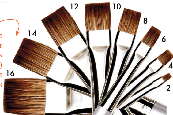
6175 - PUTOIS DE SIBERIE - ISABEY Martre pure