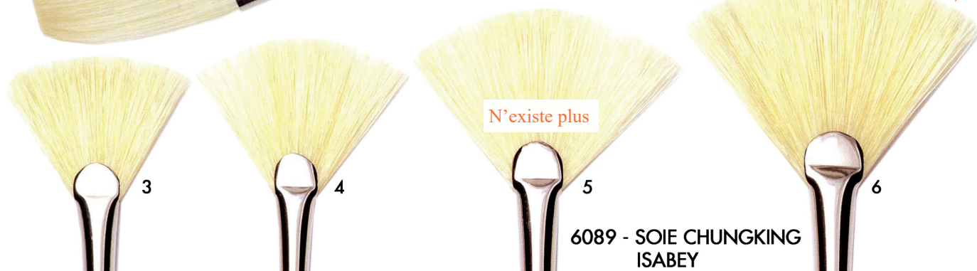
6089 - SOIE CHUNGKING ISABEY

Pointe en éventail. Parfaite pour estomper la peinture fraîche. Idéal pour réaliser herbes, feuilles, arbres.