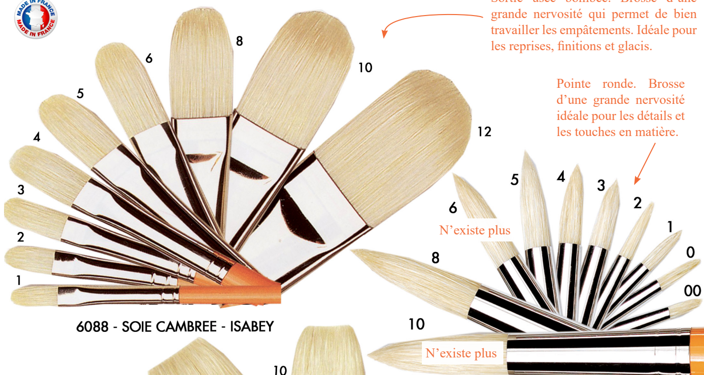
6088 - SOIE CAMBREE - ISABEY

Pointe ronde. Brosse d'une grande nervosité idéale pour les détails et les touches en matière.