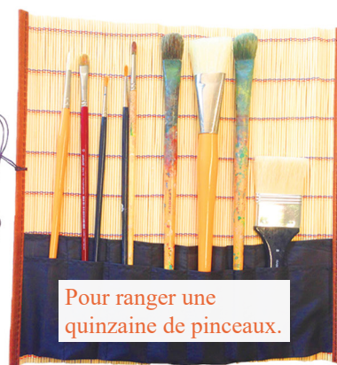
PINCELIER Bambou et tissu