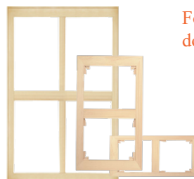
Formats européens doubles carrés